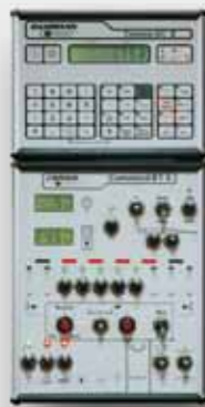
SPRAY-Control S & Bedienteil II

Individuelle Computer für Überwachung und automatische Steuerung der Spritze