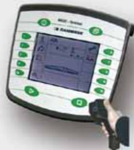
BASIC - Terminal & BASIC - Terminal TOP