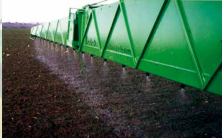
Opcja HD-Night LUX