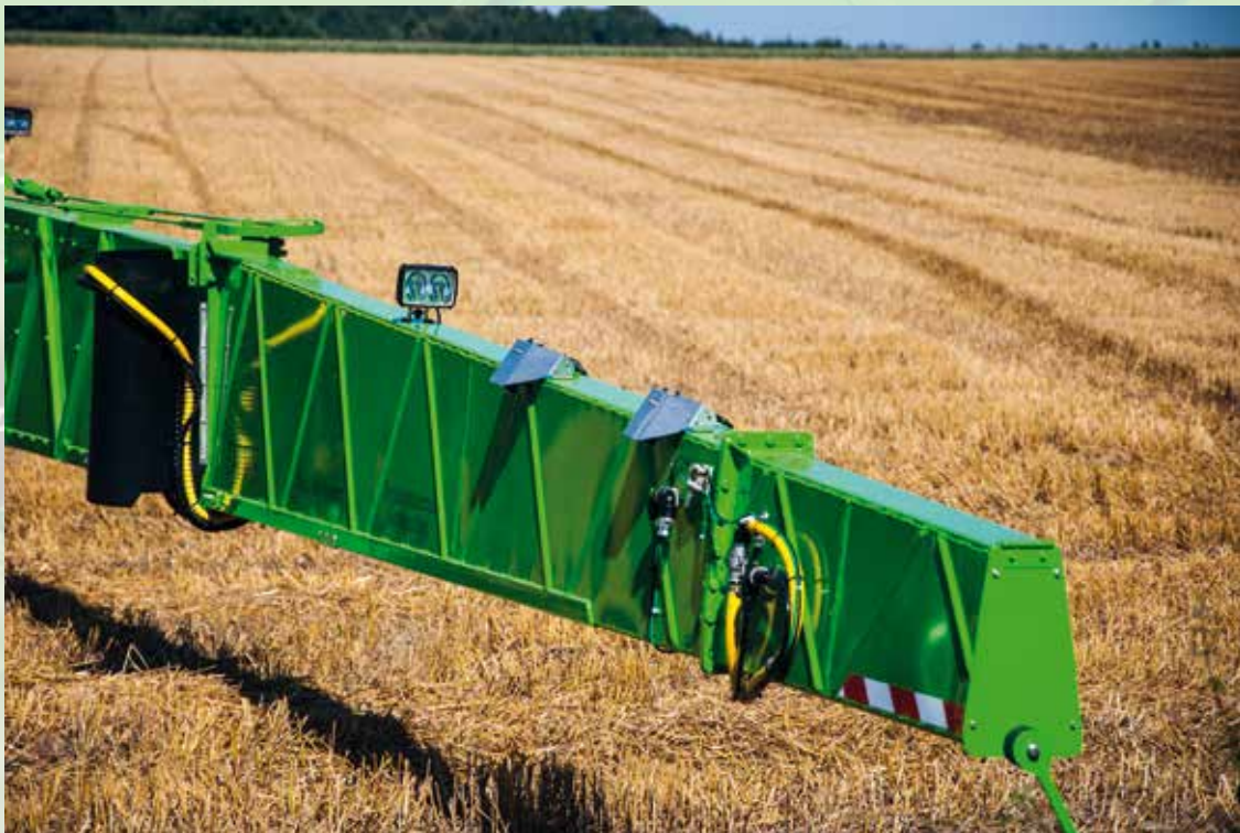
Opcjonalna płyta flanszowa